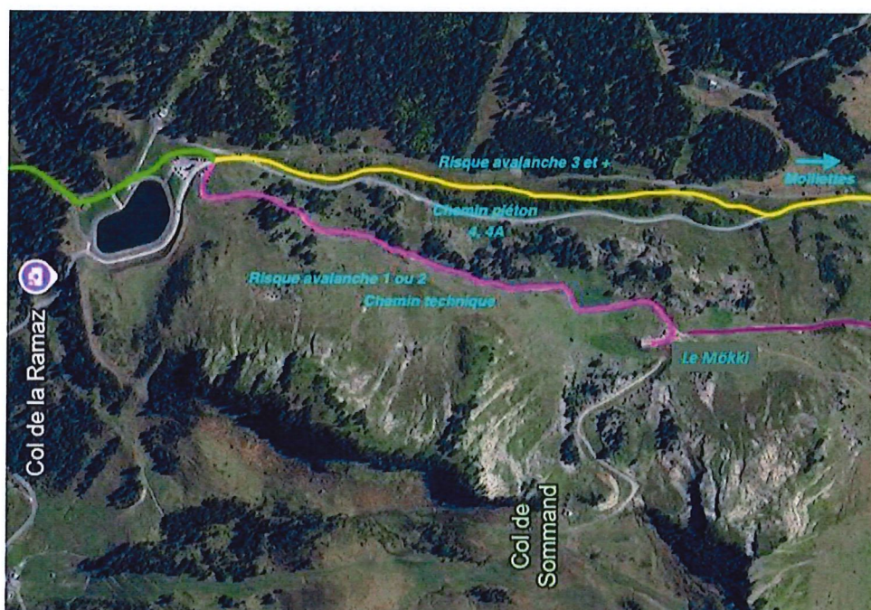
Carte 2 : Trajet de la Retenue Collinaire de La Ramaz jusqu'au Mökki ou jusqu'au Garage Les Molliettes.