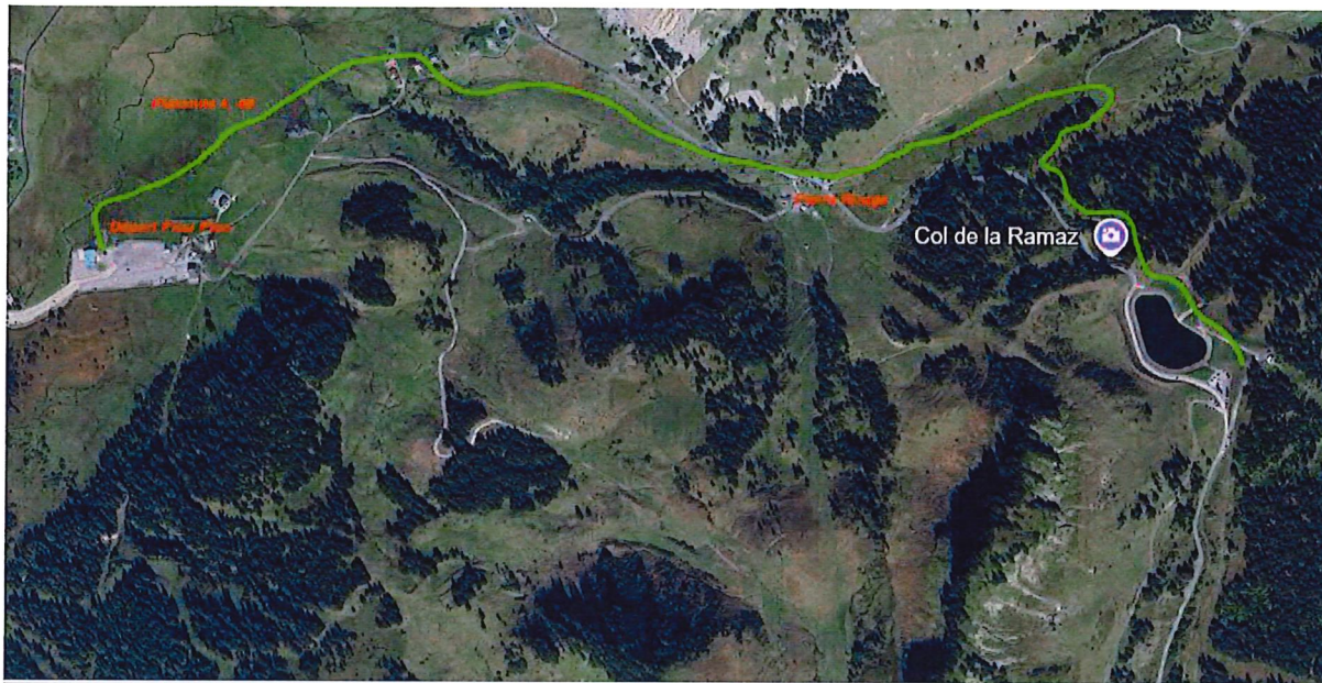
Carte 1 : Trajet « PiouPiou » jusqu'à la Retenue Collinaire de La Ramaz